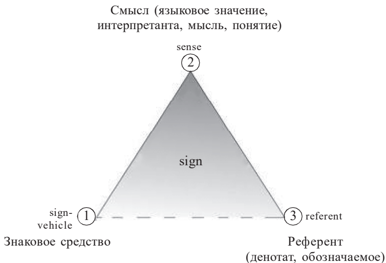
Структура знака согласно триадической модели знака

ные законы конструирования смысла (в том числе и мысли ) самой логической формой высказывания. Значение является функцией смысла подобно тому, как объект астронома обнаруживается в качестве функции от оптики телескопа (конструируемого по вполне объективным законам оптики образа).